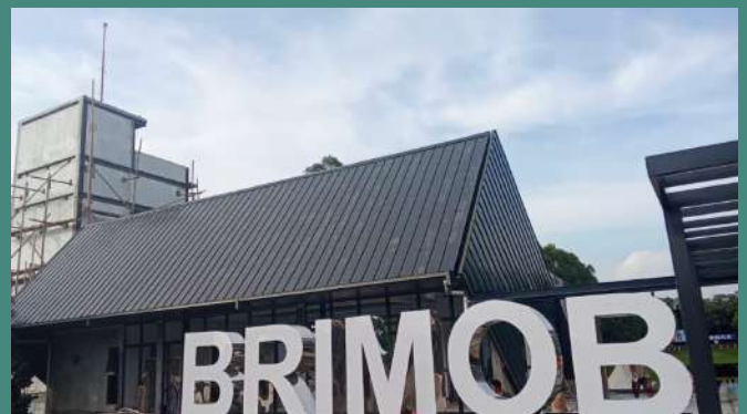
Lapangan Tembak Presisi Hoegeng Iman Santoso Korbrimob Polri Depok | Product Type: Click-330®