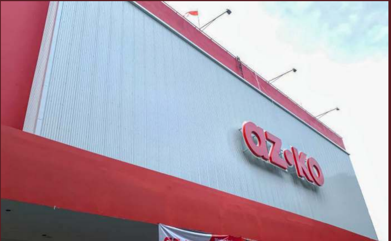
AZKO Bogor Terasutra Bogor | Product Type: G-680®